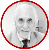
Cr. Jorge Ramos